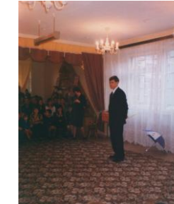
Гартунг В.К., депутат Государственной Думы РФ