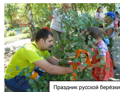
Праздник русской берёзки