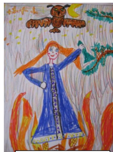
Маша Гаевская гр. № 10

Развешивая рисунки малыша в комнате либо на холодильнике, родители показывают, как они ценят малыша, а это становится для него стимулом рисовать дальше.