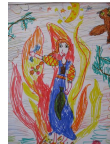
Ангелина Помыткина гр. № 7