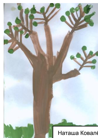
Наташа Ковалёва гр. № 9

Такую работу можно выполнять вдвоём, троём. Для этого нужно выбрать сюжет – сказку, пейзаж, натюрморт. Затем договариваются, кто что нарисует, вырезают изображение и приклеивают на общий рисунок. Коллажную работу можно дополнить кусочками ткани, бусинками, вырезками из открыток, журналов.