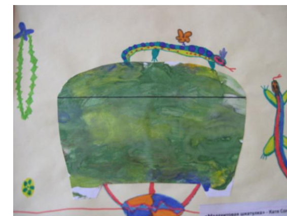
Катя Согрина гр. № 7