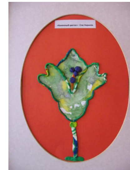
Стас Хорьков гр. № 7