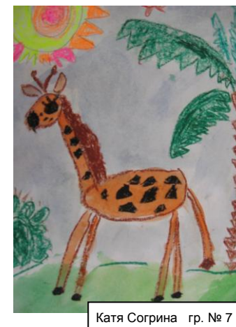
Катя Согрина гр. № 7