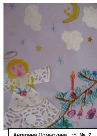
Ангелина Помыткина гр. № 7