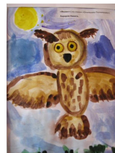
Никита Ахраров гр. № 8