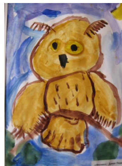
Даша Ледкова гр. № 8