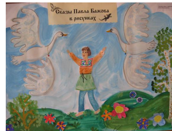
Дети кружка «Юный художник»