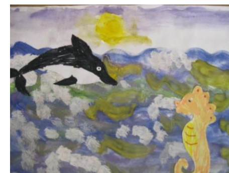
Юля Шаталова гр. № 10