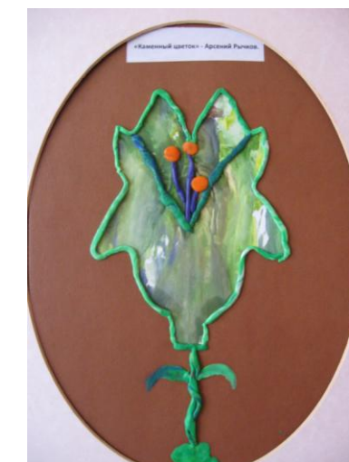
Арсений Рычков гр. № 10